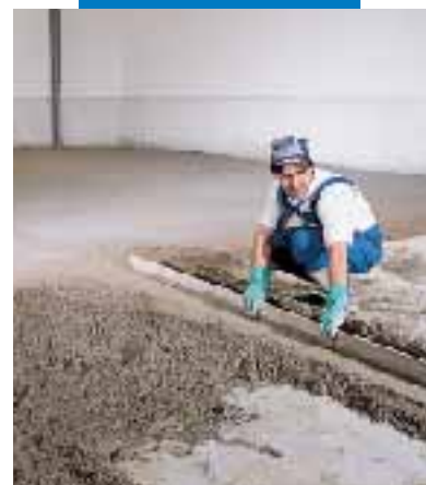
Exécution des nus de réglage