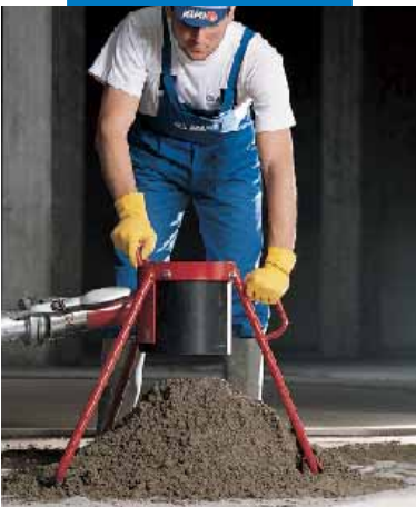
Gâchage de Topcem

nécessite d'une part, une quantité d'eau plus importante pour l'obtention d'une consistance adéquate et il ne permet pas une bonne dispersion des composants du Topcem . Si le mélange ne peut se faire autrement que manuellement (réalisation de petits travaux ou impossibilité d'utiliser mélangeur mécanique) il est conseillé de mélanger à sec et en plusieurs fois Topcem avec les charges avant d'ajouter l'eau progressivement jusqu'à obtention de la consistance souhaitée.