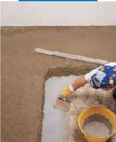
Application de la barbotine d'accrochage pour chape adhérente Topcem